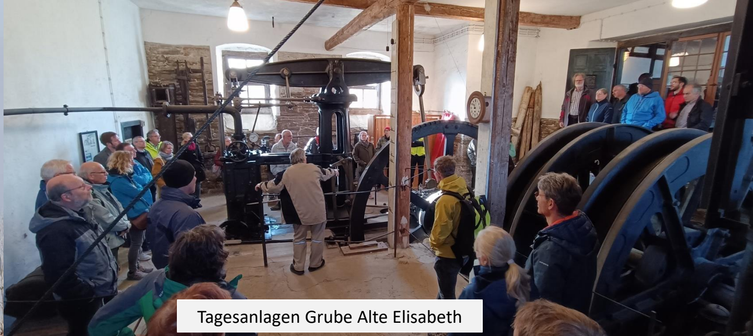
Tagesanlagen Grube Alte Elisabeth

20. Altbergbau- Kolloquium in Freiberg 2022