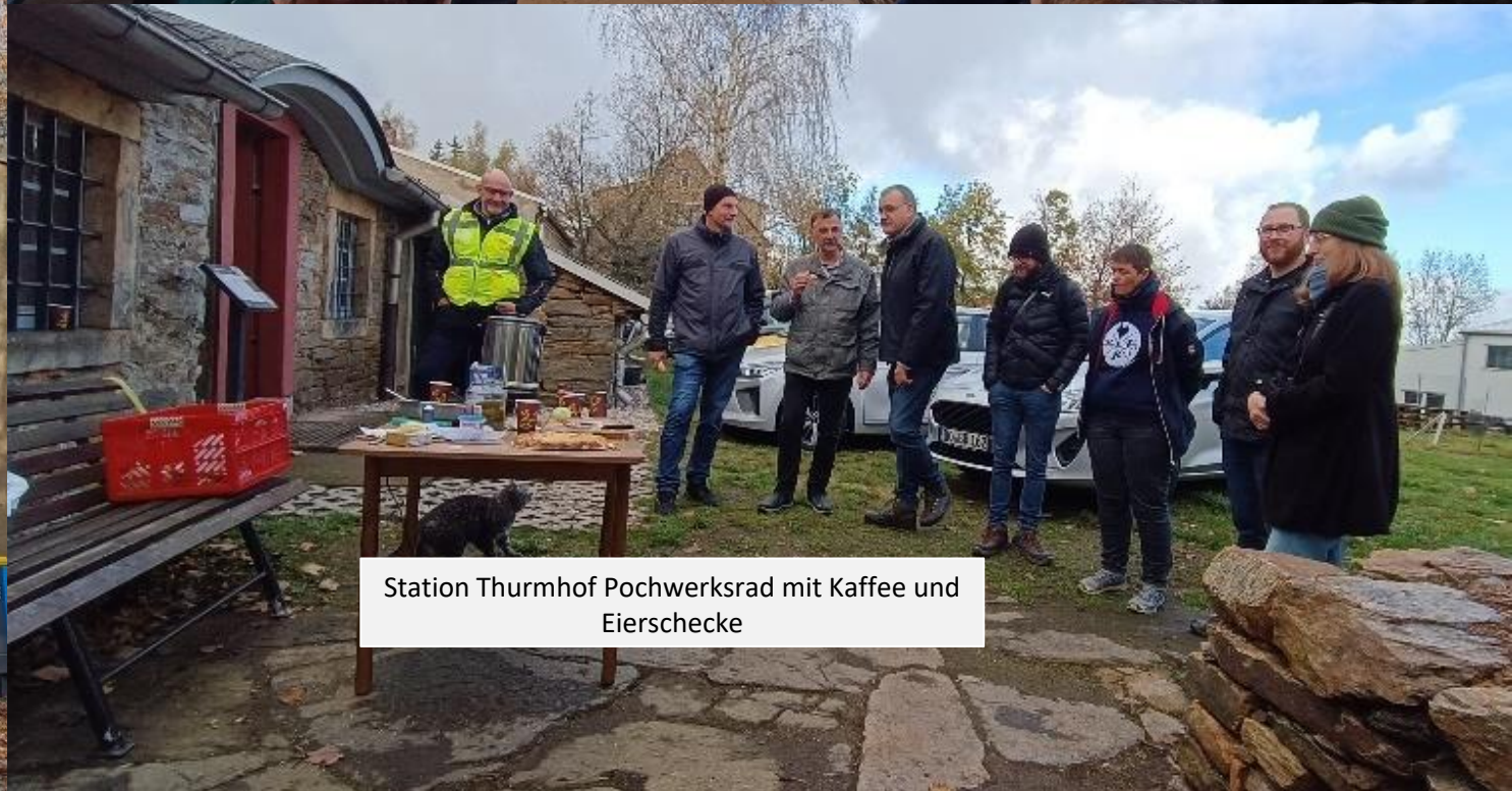
Station Thurmhof Pochwerksrad mit Kaffee und Eierschecke