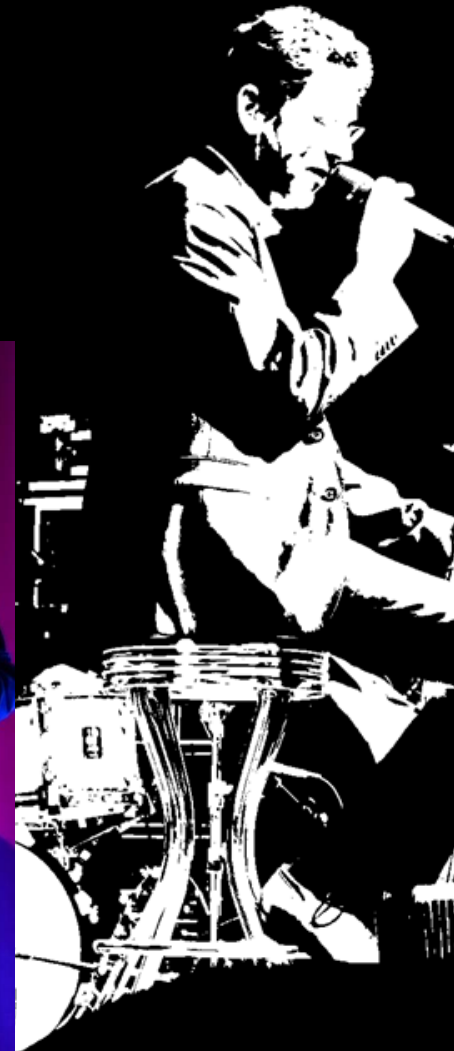
Gesellschafts- abend im Tivoli