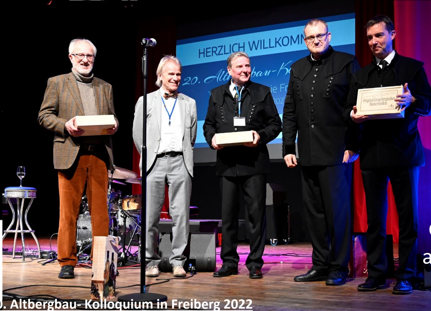
20. Altbergbau- Kolloquium in Freiberg 2022